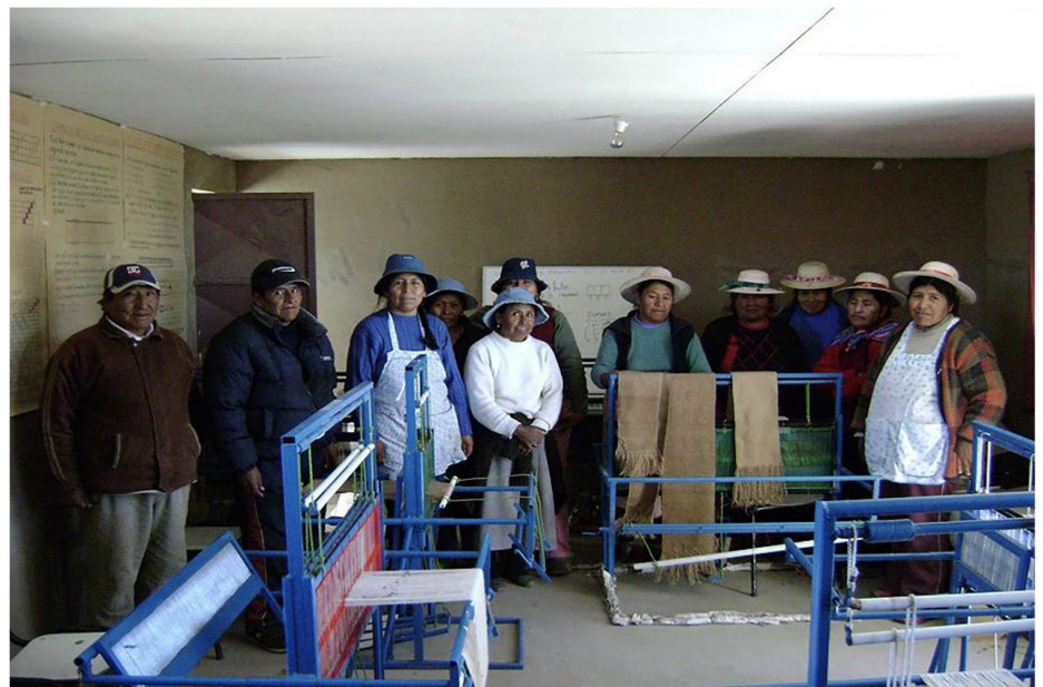
Figura 1. Agrupación de artesanas textiles en Arica a mediados de la década de los noventa.

Hoy, buena parte del proceso de comercialización e instalación de los productos en el mercado se realiza a través de plataformas digitales, algunas organizadas por el mismo Estado. Uno de los ejemplos más paradigmáticos es la Fundación Artesanías de Chile, institución público-privada orientada a la valorización y comercialización de la artesanía nacional mediante la articulación de redes y el desarrollo de programas de apoyo productivo y difusión cultural. Complementariamente,