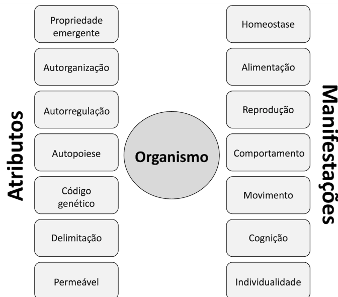
Figura 1. O organismo vivo, ilustrando seus atributos gerais e manifestações resultantes das interações com o meio. Modelo adaptado das ideias de von Bertalanffy (Drack e Betz, 2017).