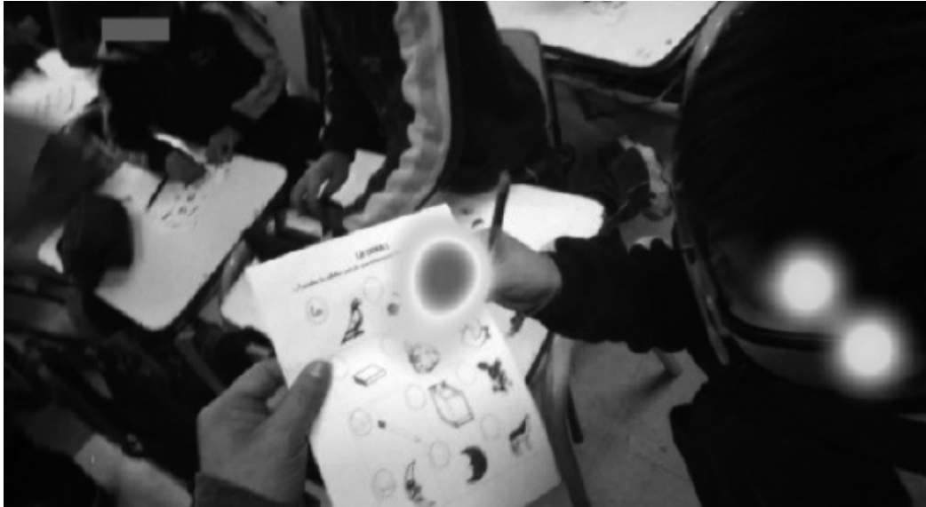
Figura 2. IcM explicativo rural. Mirada entre tarea y aprendiz.

asegura interdependencia entre los interlocutores, profesoras y alumnos.