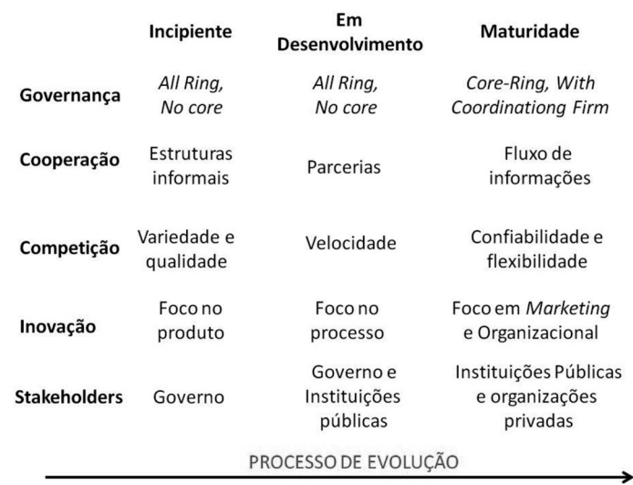
Figura 2: Processo de evolução dos APL de Alimentos e Agroempresas Familiar.